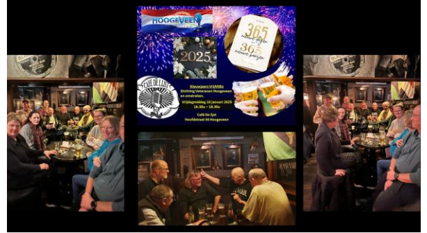
Nieuwjaarsborrel Veteranen 2025