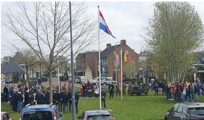
Herdenking 80 jaar bevrijding met de Belgische bevrijders van 1th Belgian Special Airservice Parachute Regiment.