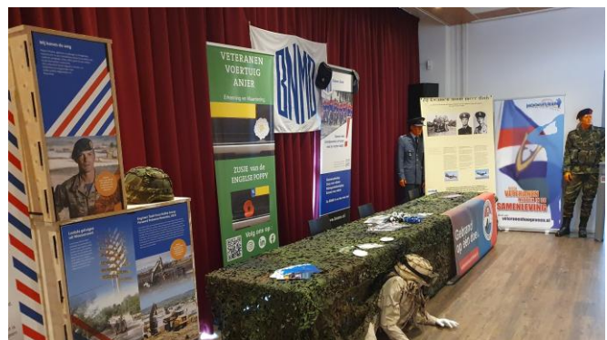
De Veteranen Stand in de bibliotheek Hoogeveen werd ook bezocht door verschillende groepen leerlingen van het middelbaar onderwijs.